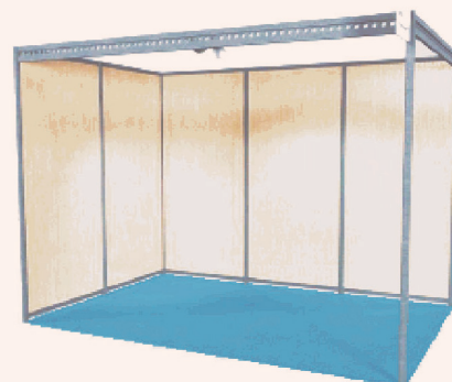
Exemple de stand (photo non-contractuelle)